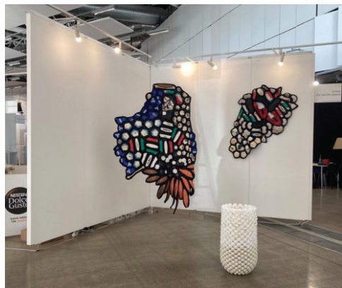
Projektas #sportathome meno mugėje „ArtVilnius'21“