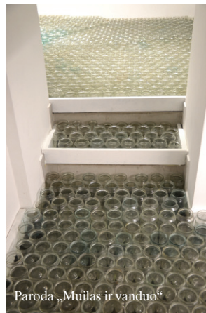
Paroda „Muilas ir vanduo“

22 d. Galerijoje „5 malūnai“ atidaroma Sigito Faraponio tapybos ir grafikos paroda „60+1“