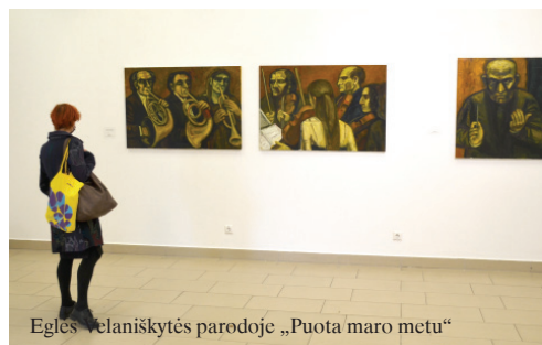
Eglės Velaniškytės parodoje „Puota maro metu“

VDA bibliotekos abonemente veikia Monumentaliosios dailės (freskos-mozaikos) bakalaurės Eglės Žostautaitės paroda „Palikti“ Telšių galerijoje veikia Aurimo Anuso paroda „Memelmort“.