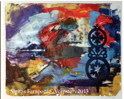
Sigitas Faraponis „Verpstė“, 2013