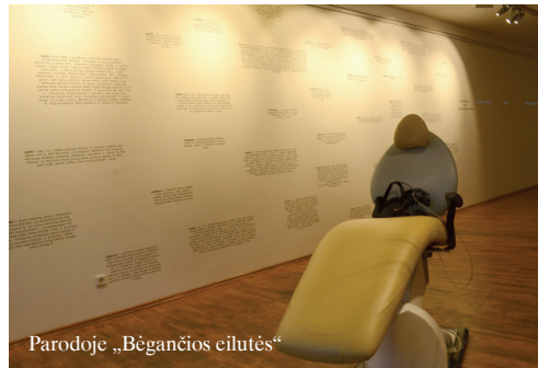
Parodoje „Bėgančios eilutės“